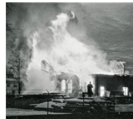
Radiofabrikken "Torotor" i brand efter sabotagen

Tror I, at tyskernes hævnaktioner fik modstandsbevægelsen til at lave flere eller færre modstandsaktioner og hvorfor?