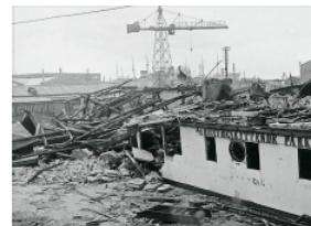
Foto: Always efter sabotagen

FØR sabotageaktionen mod Always , skriv stikord: