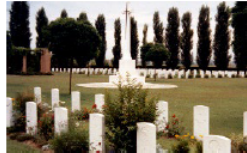
Den britiske militærkirkegård i Argenta, Italien

Den 9. april 1945 gik det dog galt for Anders, som fik til opgave at nedkæmpe en tysk stilling i Italien. Under aktionen blev Anders hårdt såret, men han nægtede at lade sig evakuere, da han ikke ville sætte sine soldaterkammeraters liv på spil for sin egen overlevelse. Aktionen blev gennemført på trods af massiv tysk modstand, men Anders døde af sine kvæstelser.